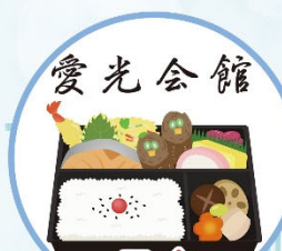
愛光会館 昼食 (プラン限定メニュー)