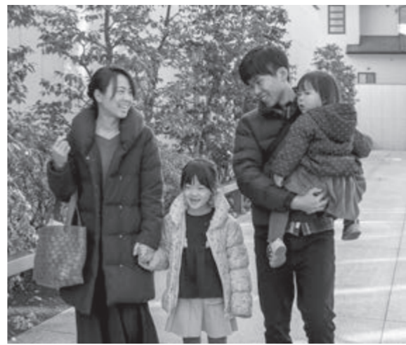
心が通い合う家庭が明るい未来を

親なら、誰もが我が子の仕合せを願うものです。そのため必要となる、乳幼児期、少年期、青年期、また一人親で育つ子どもへ、神は指図を下さっています。親の心の在り方をかみ、温かな家庭を築く中で、我が子の心を素直で豊かに成長していくのです。