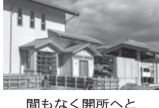
間もなく開所へと

全国で三十四万戸目となる偉光会館の建設が、大分で進んでいます。既に建物ほぼ完成。四月二十一日の開所式に向けて、人々の期待も一段と高まっています。